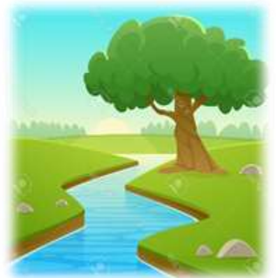
Imagen 1: http://farm6.static.flickr.com/5268/5567389451_597c08cab9_o.jpg