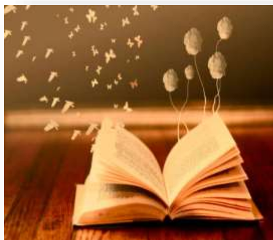
Imagen 1: http://fusagasuganoticias.com/word/wp-content/uploads/2017/06/poes%C3%ADa-1.jpg Imagen 2: http://conceptodefinicion.de/wp-content/uploads/2014/06/Poes%C3%ADa.jpg

La poesía es la inspiración de mi corazón Que nace a través de una canción